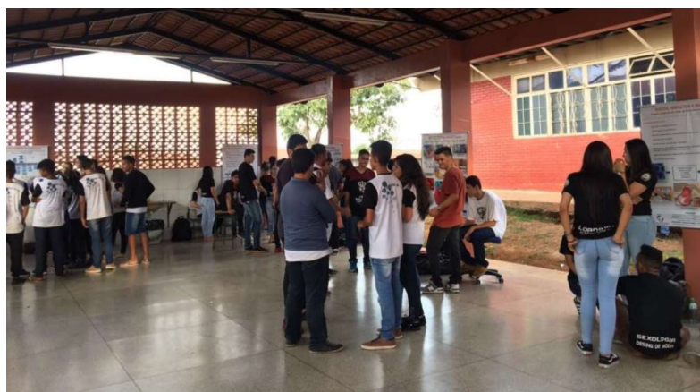
Figura 4: Fotografia do momento de socialização dos questionamentos com a exposição de banners.

Nesse encontro o professor deve distribuir os banners em diferentes posições do pátio ou área comum da escola para que toda a comunidade escolar possa se socializar com as informações expostas e com as explicações dos alunos. A figura abaixo apresenta uma fotografia desse momento: