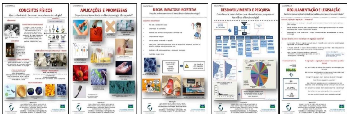
Figura 3: Banners contendo os macrotemas.